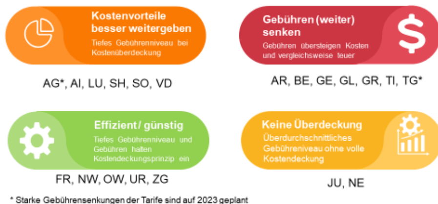
Abbildung 1: Einteilung der Strassenverkehrsämter in den Kantonen ohne massgebliche Gebührenanpassungen seit 2019 in vier Kategorien mit den beiden Dimensionen Gebührenniveau 2022 und Kostendeckungsgrad 2019

Kantone, die trotz hoher Gebühren die Kosten nicht oder nur knapp zu decken vermögen, müssen sich die Frage gefallen lassen, ob sie den Aufwand senken könnten, indem sie die Effizienz (weiter) steigern. An dieser Stelle sei lediglich eine Möglichkeit zur Effizienzsteigerung genannt. Alle Kantone sollten unverzüglich ein mancherorts schon bewährtes Reparaturbestätigungsverfahren gegen Unterschrift ermöglichen: Das Auto soll nicht mehr zur Nachkontrolle zum Strassenverkehrsamt gebracht werden müssen. Vielmehr soll die Garage dem Strassenverkehrsamt direkt und digital die Behebung der Mängel melden, sofern sie für Reparaturbestätigungsverfahren und für Nachkontrollen zugelassen ist.